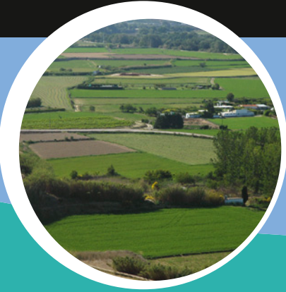
Juslibol en primavera